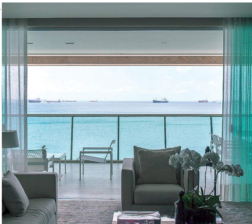
Varanda com sacada de vidro, em projeto de David Bastos