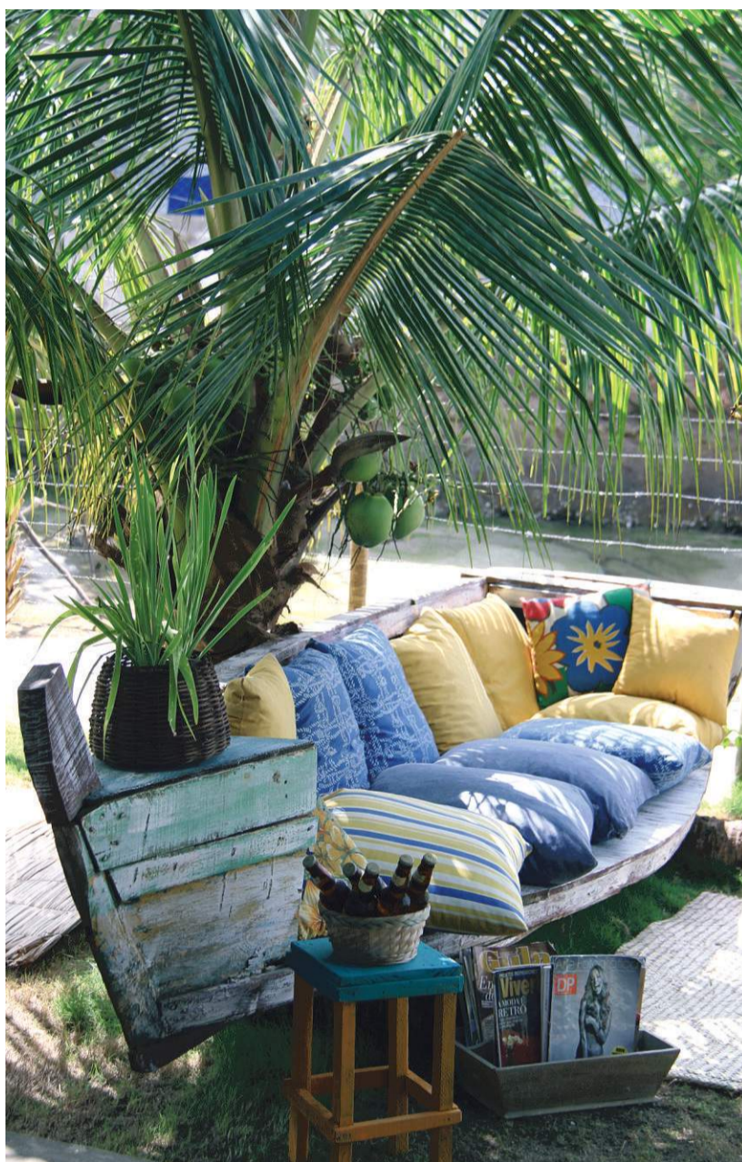
O sofá do restaurante Preta, em Ilha de Maré: barco reutilizado