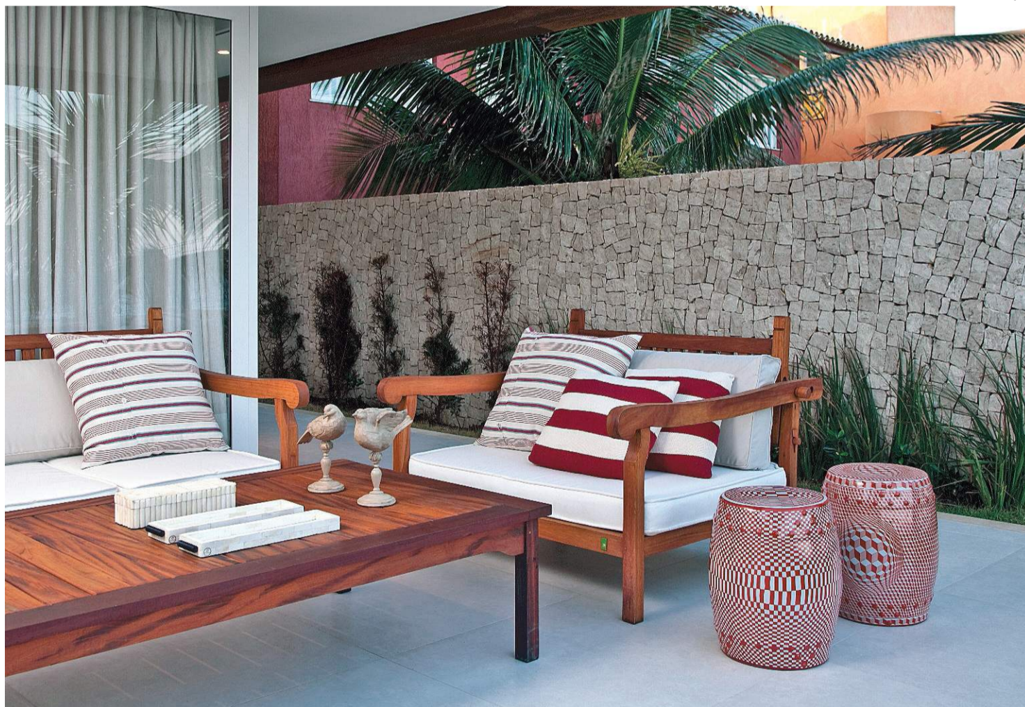
Outro ambiente da casa de Quintela na Praia do Lago: móveis de madeira, cores claras e alegres, muro de pedra portuguesa e plantas

PAREDE ENVIDRAÇADA Se a opção for mesmo fechar a varanda - ou se o cômodo em questão for um quarto, por