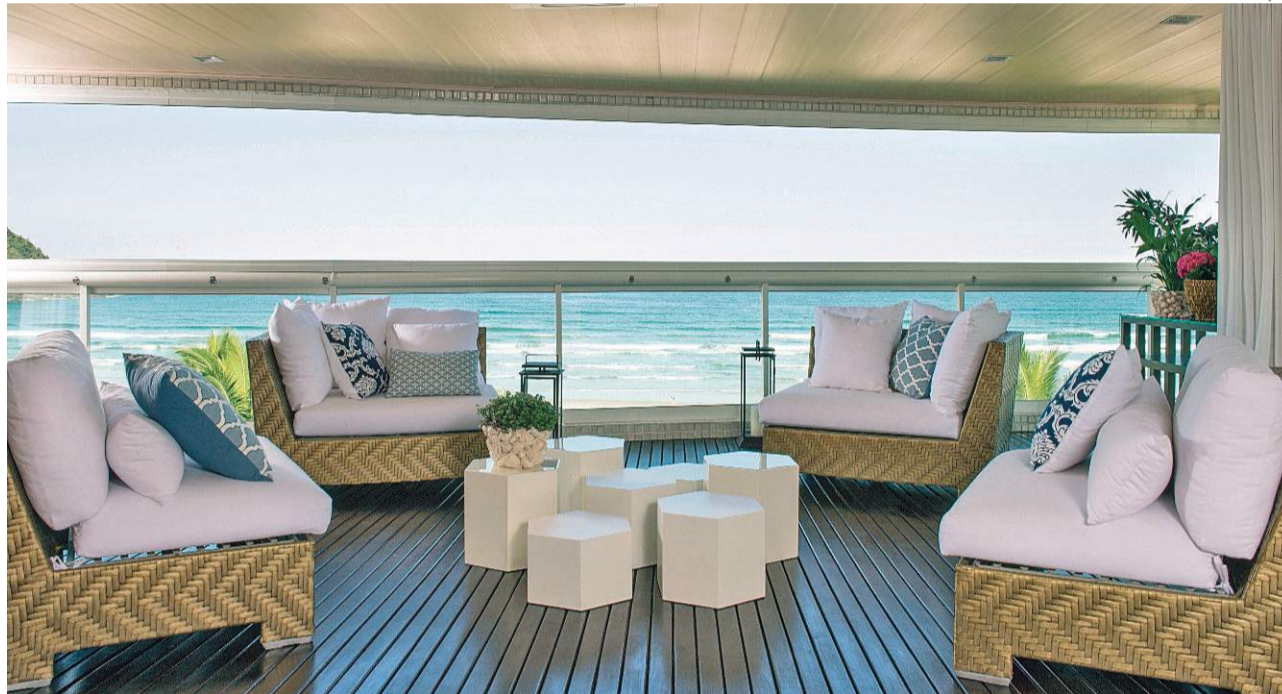
Apartamento projetado por Maurício Karam, em Bertioga (SP): varanda e sala unidos, mantendo identidades diferentes