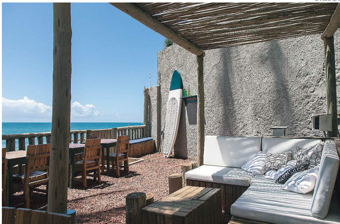
Blue Praia Bar, na Praia do Buracão (Rio Vermelho): rusticidade em madeira que privilegia a vista do mar

de ter o porcelanato arranhado, o estofado rasgado ou o papel de parede mofado.