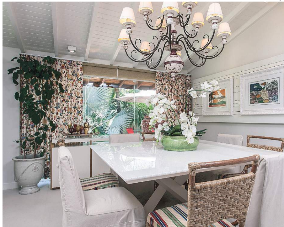
...E no mesmo imóvel, em Interlagos, sala de jantar integrável com a varanda