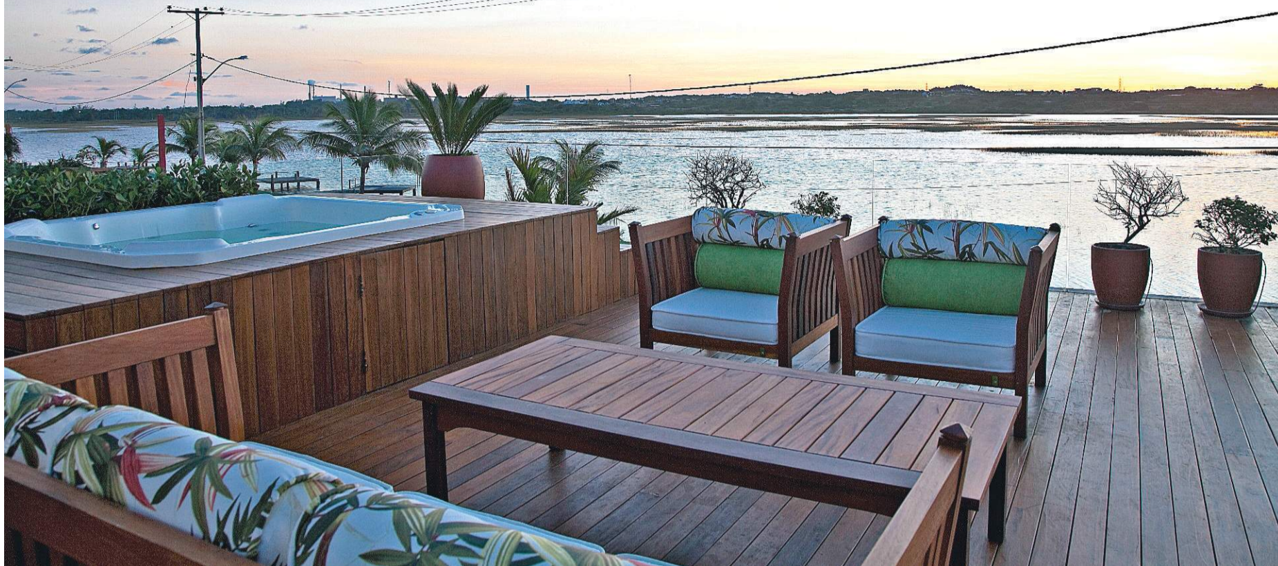
O deck da casa projetada pelo arquiteto Sidney Quintela na Praia do Lago (litoral norte baiano): madeira maciça, tecidos impermeáveis e formas simples compõem visual despojado

Confira dicas para arrasar na decoração de casas e apartamentos que ficam pertinho da praia