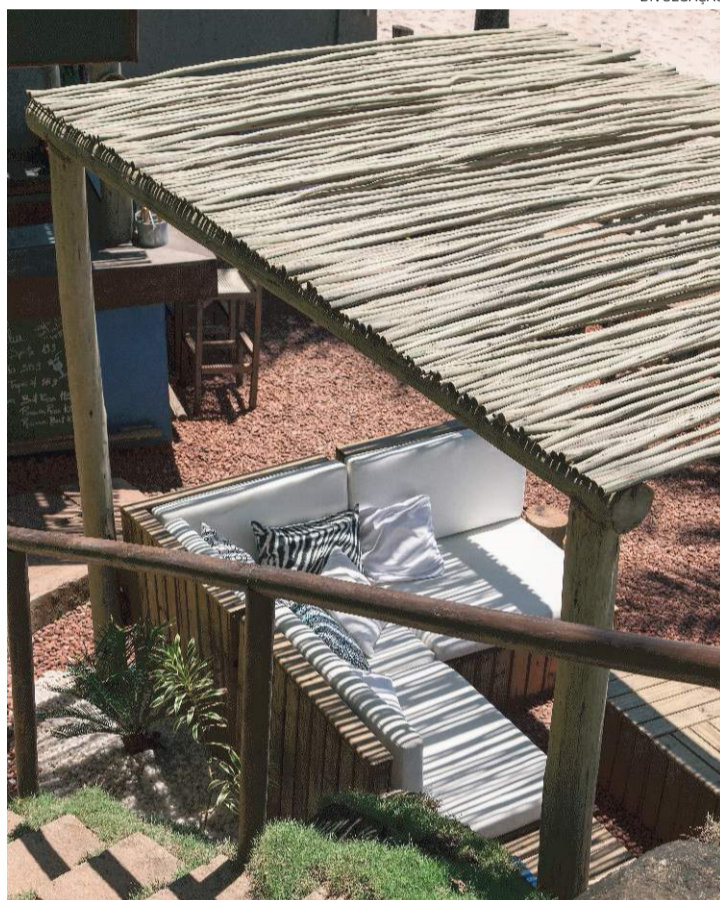
Pergolado coberto com gravetos de eucalipto é alternativa a tecido