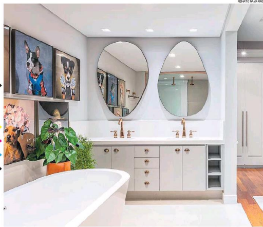
Ponto focal. Espelhos com formatos inusitados ganham destaque na decoração

Como espelhos refletem a luz, sua colocação estratégica pode ajudar a iluminar ambientes mais escuros. Se você tiver um quarto com apenas uma janela, por exemplo, coloque um espelho em frente a ela, para refletir a luz do sol de volta para o quarto. Já se sua sala receber mais luz de manhã ou no fim da tarde, esses momentos podem se tornar ainda mais poéticos com um bom espelho posicionado. Cuide apenas para que esta situação não provoque ofuscamento visual.