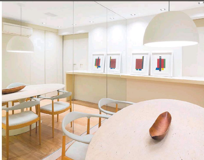
Cozinhas e copas. Espelhos duplicam ambientes, mas é preciso ter cuidado para não refletir áreas indesejadas

Além disso, apesar de evidente, é importante observar que espelhos duplicam tudo o que existe dentro ou fora dos ambientes, incluindo o que é indesejado. E o que acontece, por exemplo, quando colocamos um espelho em uma sala de jantar, frente a um grande lustre, o