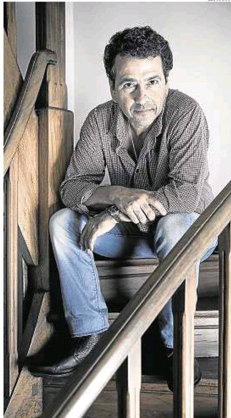
Do mal. Marcos Palmeira: "Ainda não sei em que político vou me inspirar"

• Ele também está se programando para voltar aos palcos, num espetáculo infantil. "Olha que louco, é uma peça sobre a falta d'água! Tem coisa mais atual?". O lado empresário é o que o deixa mais inseguro. "Aí o ano vai ser complicado. Mas torço por boas surpresas", diz o ator, que produz e vende alimentos orgânicos.