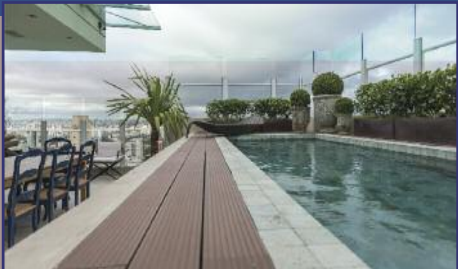
Gabrielle- Campo Belo- São Paulo-SP Cobertura redesenhada e ampliada - Suite, sala de estar e home theater. Criação de suite Máster, salas de TV e de leitura. Paineis de madeira ocultam a churrasqueira e a nova Piscina, revestida de pedra Hijaú.