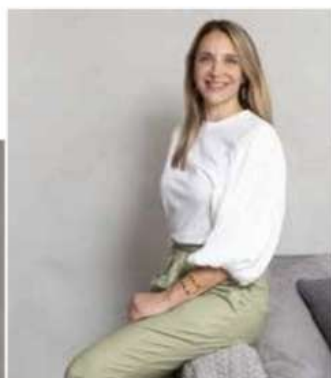
ANA TOSCANO ARQUITETURA @anatoscanoarquitetura

UMA SELEÇÃO DE PROJETOS E AMBIENTES NOS MAIS DIVERSOS ESTILOS, EM DIFERENTES COMPOSIÇÕES E VOLTADOS PARA AS NECESSIDADES DOS MORADORES. DESCUBRA ESPAÇOS PARA INSPIRAR O DÉCOR DA SUA CASA!