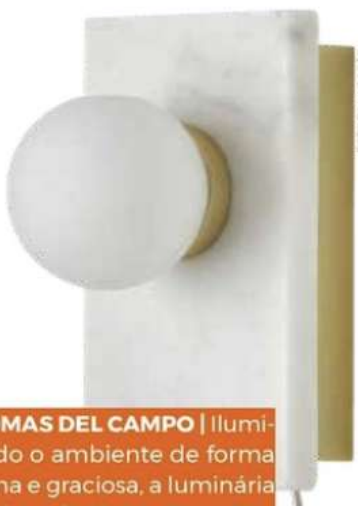
AROMAS DEL CAMPO | Iluminando o ambiente de forma íntima e graciosa, a luminária Lan desenhada por Pepe Fornas traz elegância. Personalizada em mármore, está disponível nas cores branca e preta, conferindo modernidade ao espaço