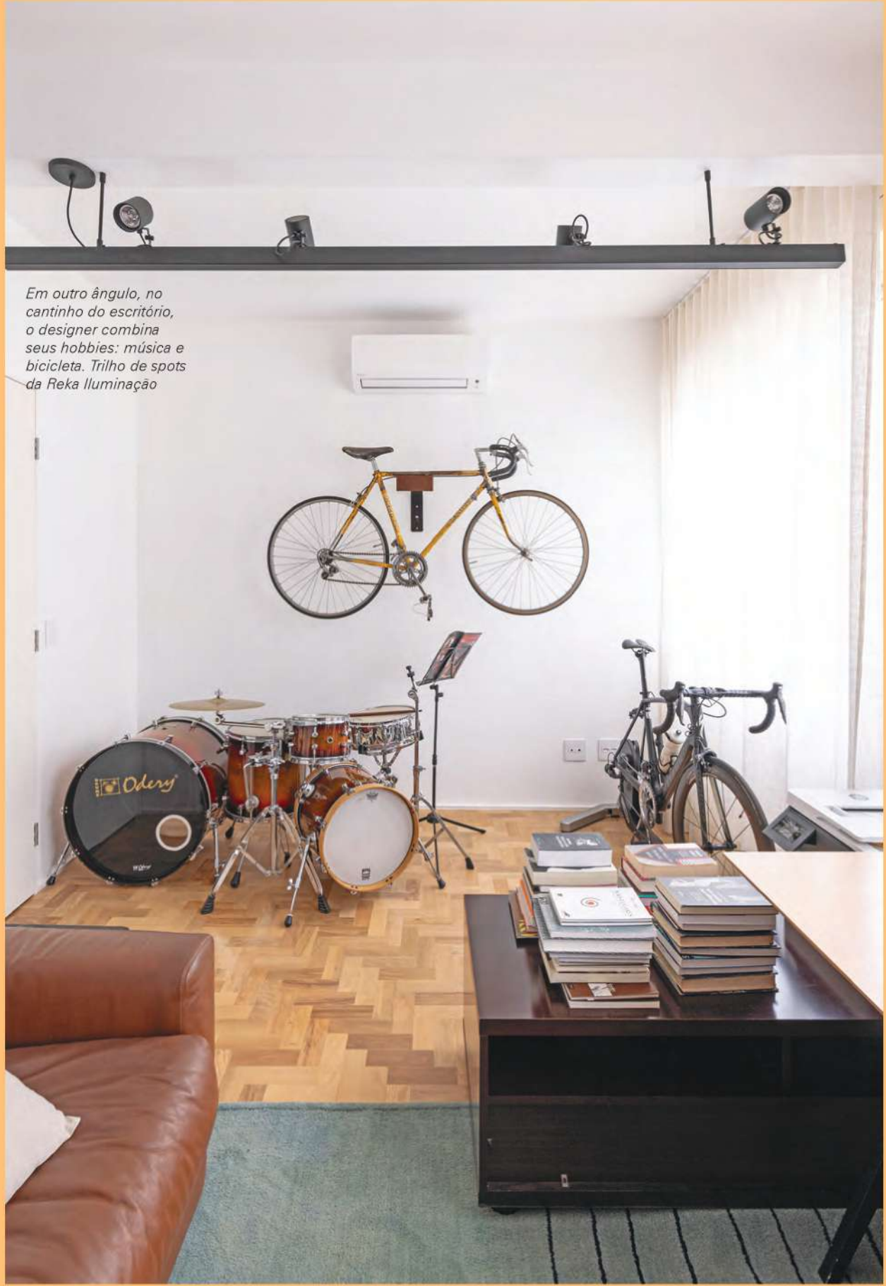
Em outro ângulo, no cantinho do escritório, o designer combina seus hobbies: música e bicicleta. Trilho de spots da Reka Iluminação